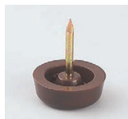
プラパートA 87695-X ¥150 サイズ: 21φ×8