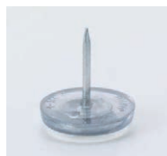
プラパートB 87696-X ¥200 サイズ: 21φ×6