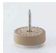
プラパートD 87001-X ¥350 サイズ: 21φ×10 底部: フッ素樹脂 適床材: カーペット・絨毯