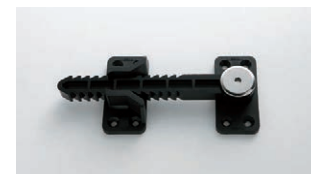
オプションジョイント 31040-X ¥1,500 サイズ: 140×66×22 ※オプションのみご注文の際は、送料を別途ご負担いただきます。