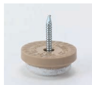
プラパートC 87697-X ¥250 サイズ: 21φ×9 底部: フェルト 適床材: フローリング